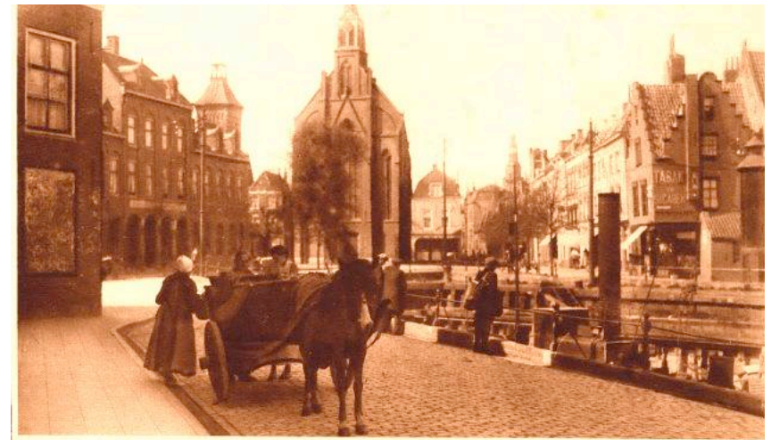
Een kijkje op het Drooge Dok. O.Z., alwaar een groentevrouwte bezig is haar waren aan den man te brengen. Op den achtergrond de R.K. Kerk.

1855 Op dezelfde plaats aan de Pottekaai wordt een nieuwe kerk gebouwd. Vlissingen telt dan ongeveer 2000 katholieken. De plechtige consecratie door Bisschop Van de Vree vindt plaats op 28 juli 1858. De patroonheilige blijft St. Jacobus de Meerdere.