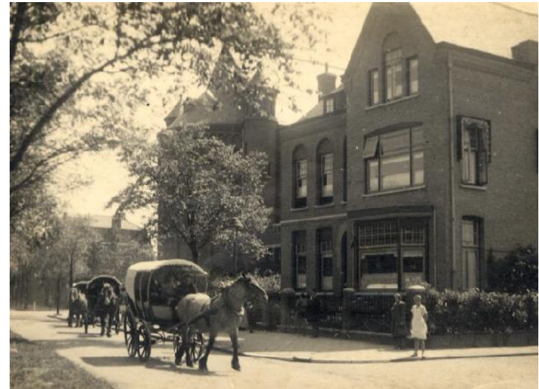
Trouwen in oorlogstijd. Trouwkoets voor de pastorie aan de Singel

Zie ook hierna over de invloed van het Tweede Vaticaans Concilie.