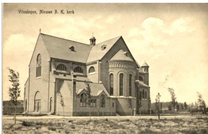
De kerk zoals in 1911 voltooid

Op 2 juni 1913 wordt de kerk geconsacreerd door bisschop Callier. (Vlissingse Courant 2 juni 1913):