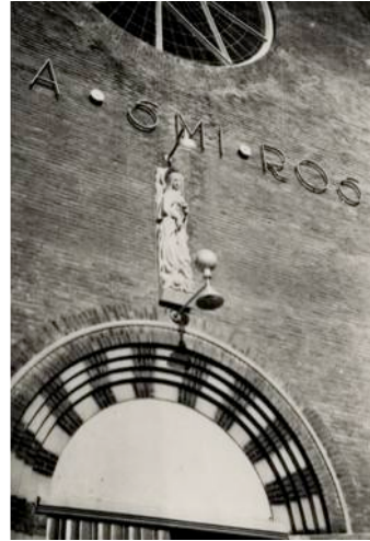
Tekst boven het Mariabeeld: REGINA SANCTISSIMI ROSARII (Koningin van de Allerheiligste Rozenkrans)