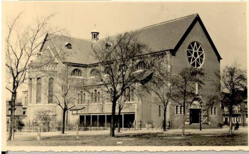
1939 De uitgebreide kerk is gereed