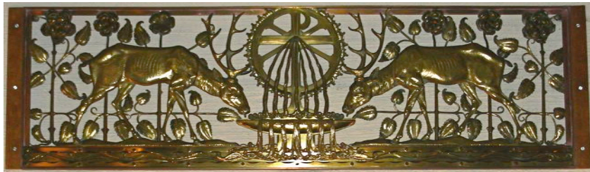
Twee herten bij een bron van zeven stromen.

De fraaie geelkoperen versieringen en deuren worden bewaard. De deuren krijgen een plaats bij het sacramentsaltaar, de versiering aan de wanden van het koor en tegen het altaar. Twee ervan zijn hieronder weergegeven: