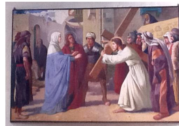
Eén van de staties van de kruisweg, in 1921 geschilderd voor de Onze Lieve Vrouwekerk, door de in Vlissingen wonende kunstschilder Hagebaert