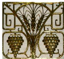
Korenaren en druiventrossen