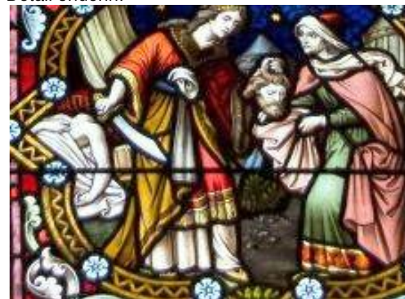
Judith met het hoofd van Holofernes