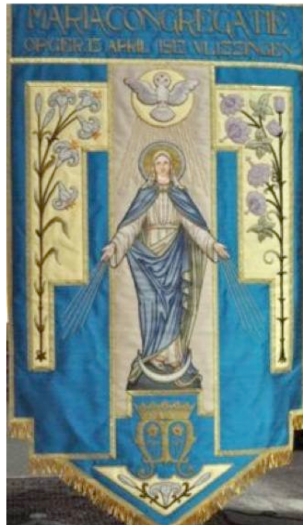
Vaandel Mariacongregatie, opgericht 13 april 1913