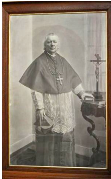
Bisschop A.J. Callier Vlissingen 1849 - Haarlem 1928, afkomstig uit het gezin van een Belgische loods

De reden voor een tweede kerk is de groei van de parochie. De kerk aan de Pottekaai kan echter niet uitgebreid worden. De bisschop van Haarlem, monseigneur Callier geeft het advies voor de bijkerk.