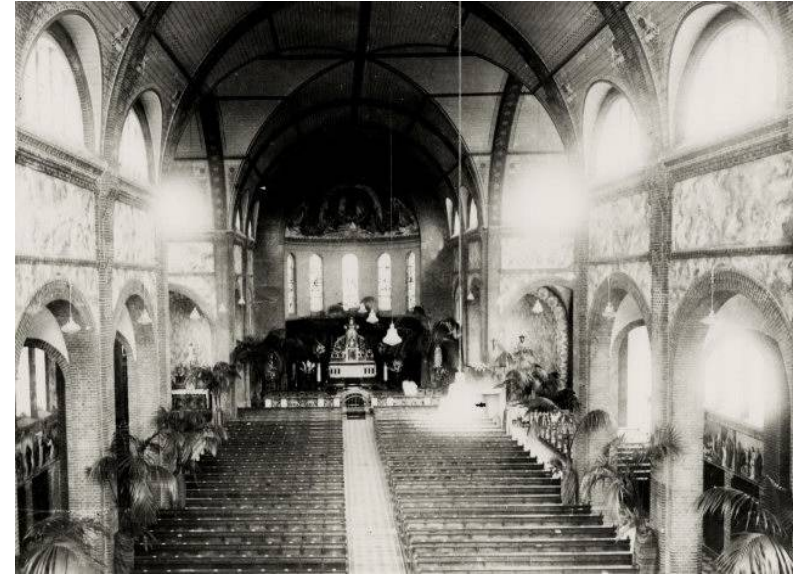
De kerk van binnen in 1939