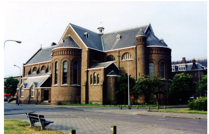
Gezicht vanaf de Brouwenaarstraat/Singel