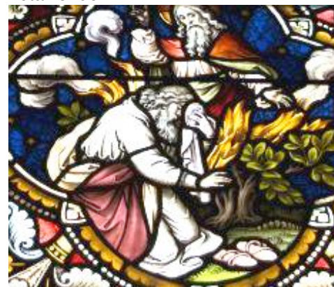
Mozes in het brandend braambos