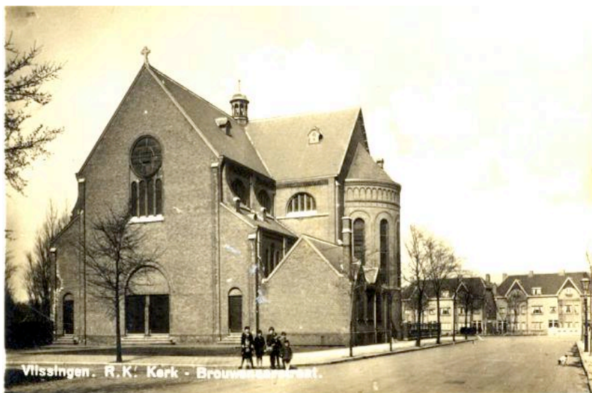
Vlissingen. R.K. Kerk - Brouwersgracht.

1935 Op de achtergrond panden aan de Schuitvaartgracht