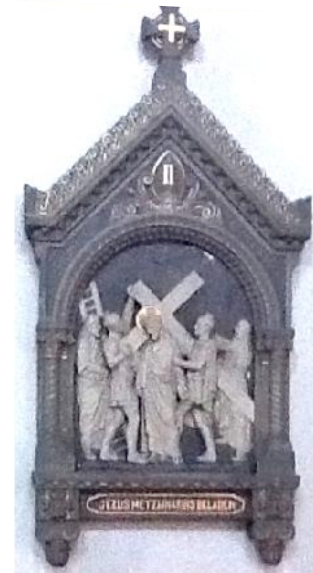
Eén van de staties van de kruisweg, tot in 1949 in gebruik in het klooster van de Zusters van Roosendaal (St. Annaschool) op het Bellamyplein. De kruisweg is in ongeveer 1970 geplaatst in de Onze Lieve Vrouwekerk