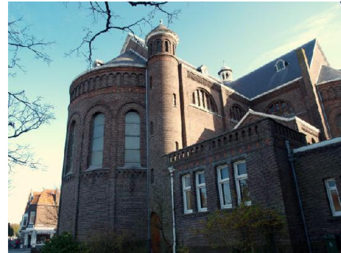
Gezicht op de Singelkant van de kerk