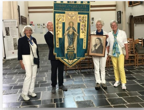
Foto bezoeker kerk