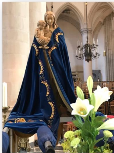
Maria, onze mantel der Liefde

Parochieblad van de H. Maria Parochie Walcheren