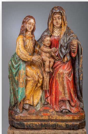
HH. Anna en Joachim

Parochieblad van de H. Maria Parochie Walcheren