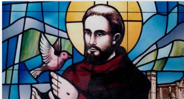
Sint Franciscus van Assisi

Parochieblad van de H. Maria Parochie Walcheren