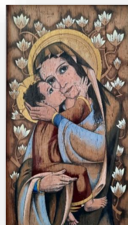
Eén van de Mariaschilderijen van mijn grootmoeder

“Dag Lieve Heertje. Dag Lieve Vrouwtje. Dag engeltje zoet, dat alle kindertjes Speckens vannacht bewaren moet. Kindje Jezus, lief en klein, houdt mijn hartje rein”.