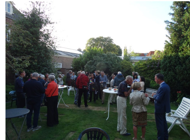
Tekst en foto's Trudy van Hoof