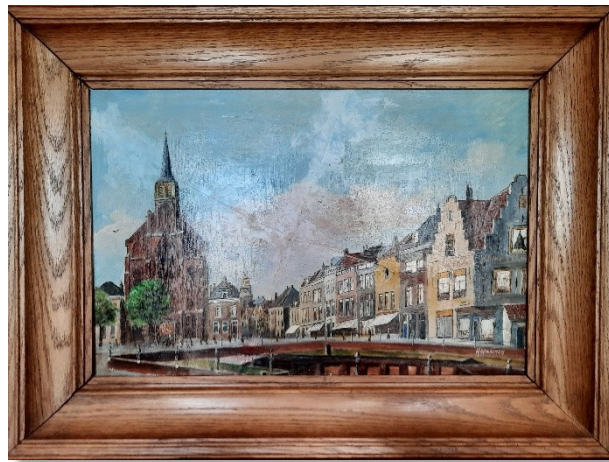
Rk. kerk aan de Pottenkaai door E. Aspeslagh

Dat was de Sint Jacobuskerk aan de Wilhelminastraat. Toen die St. Jacobuskerk ingewijd werd op 28 juli 1858 door monseigneur De Vree van Haarlem heette deze straat overigens nog Pottekaai.