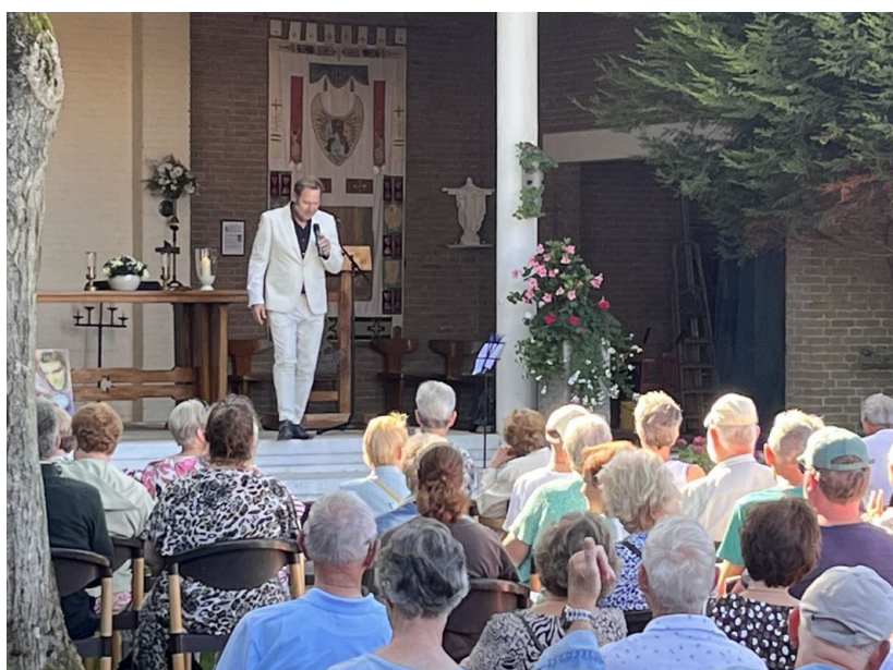
Elvis-viering 2023

Iedereen is van harte welkom in de toeristenkerk Emmauskerk om de Elvisviering mee te beleven. Adres Houtenhandlaan 6 , 4371PW Dishoek,