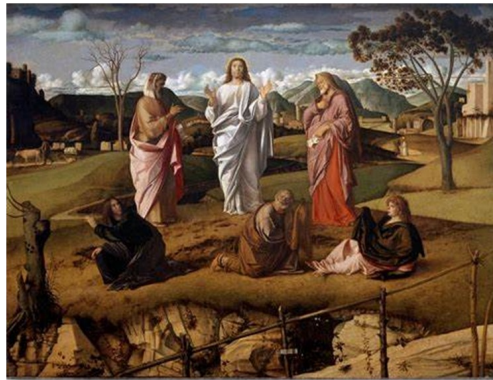
De transfiguratie des Heren

Parochieblad van de H. Maria Parochie Walcheren