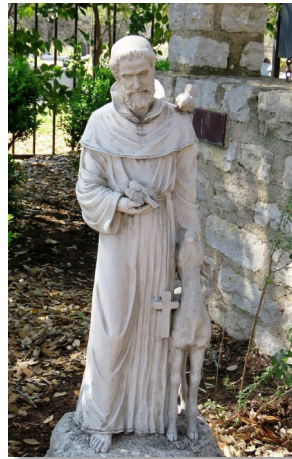
Franciscus van Assisi

Parochieblad van de H. Maria Parochie Walcheren