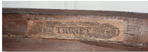
Het gaat hier om de zogenaamde originele Thonetstoelen. Van vooroorlogse kwaliteit bovendien!