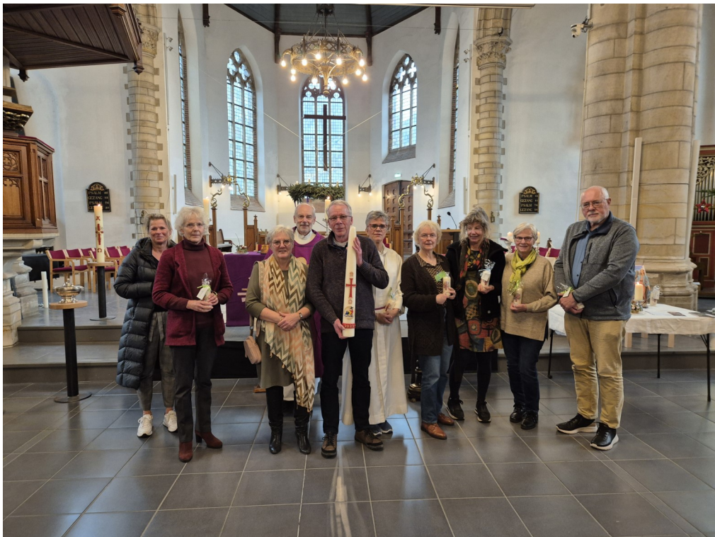
laatste zondagviering met leden van de werkgroep, afvaardiging PKN en de voorgangers.