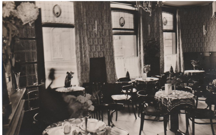
De Tearoom bij de opening in 1929 met Thonet-meubilair.

En daar hoorde een voor die tijd modern interieur bij. Met tafeltjes en stoeltjes van het merk Thonet. Men ging niet voor minder! Op de foto hieronder staat het interieur te pronken met zilveren vaasjes op de tafeltjes. Die vaasjes die al weldra de aandacht van het dievengilde trokken en daarom alras verdwenen uit het interieur.