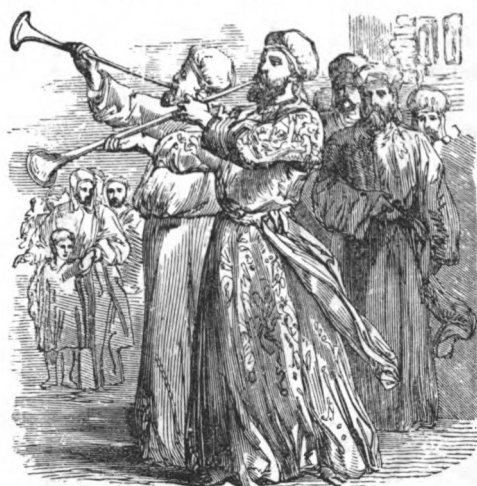
De Leviëten schallen de lamshoorn om het jubeljaar aan te kondigen (illustratie uit 1873)

Het Hebreeuwse woord yobhel , waar 'jubel' vandaan komt, zou verwijzen naar een blaasinstrument, mogelijk een ramshoorn. Dit verwijst naar de klanken van bazuinen waarmee een Israëlistisch jubeljaar begon. Yobhel werd vergriekst tot iobelos en iabelaios , waarvan het Latijnse iubilaeus is afgeleid; daarvandaan komt het Nederlandse woorden 'jubileum'. Het woord 'jubelen' is echter afkomstig van het Latijnse iubilare , dat 'juichen' betekent. Het eerste deel van het woord 'jubeljaar' komt dus niet van 'jubelen'. De Willibrordvertaling van 1974 spreekt dan ook niet van 'jubeljaar' maar van ' jobeljaar '.