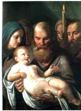
Licht van de nieuwe wereld

Parochieblad van de H. Maria Parochie Walcheren